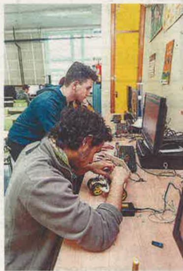
En el taller aprenden a hacer robots.

partir de las sensaciones que le han transmitido sus protagonistas, se detiene en la «seguridad» que adquieren de cara a su etapa universitaria al aprender a trabajar con «precisión» y «rigor»: «Ninguno se arrepiente de haberlo cursado».